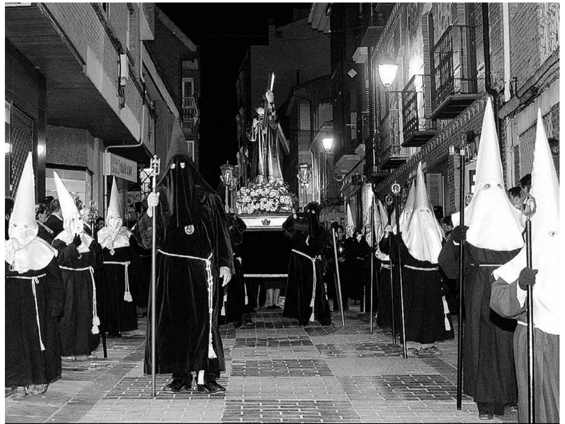
Procesión de los Nazarenos de la Cofradía de la Santa Vera Cruz

Bajo los objetivos de guiar el desarrollo de la Pasión y salvaguardar su buena celebración, la Semana Santa benaventana